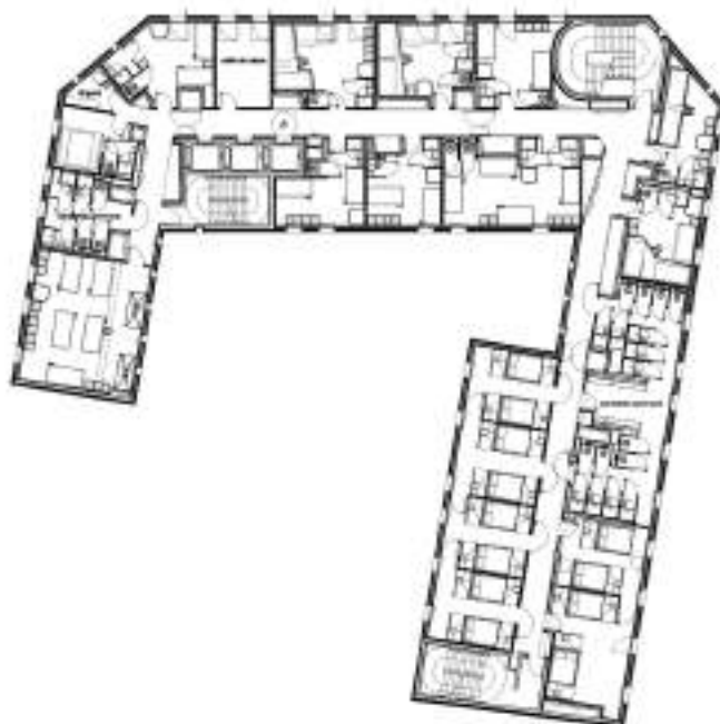
PLAN DU R+3 (ÉTAGE COURANT) LEVEL 3 FLOOR PLAN (SIMILAR PLANS FROM LEVEL 1 THROUGH 5)