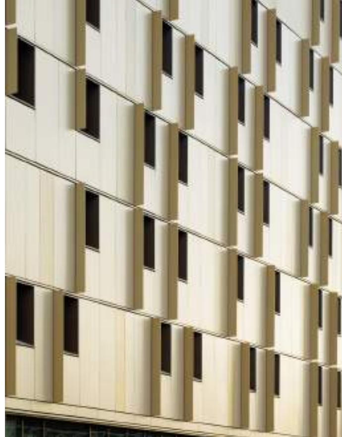
FAÇADE EN ALUMINIUM ANODISÉ ANODISED ALUMINUM FACADE