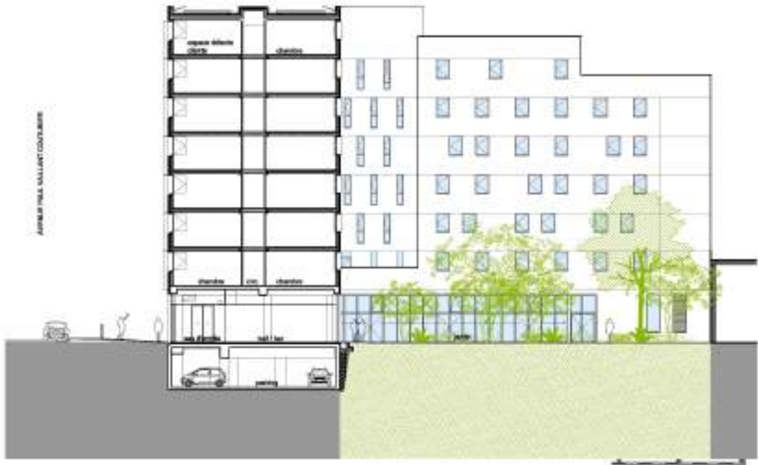
COUPE BA 1/200