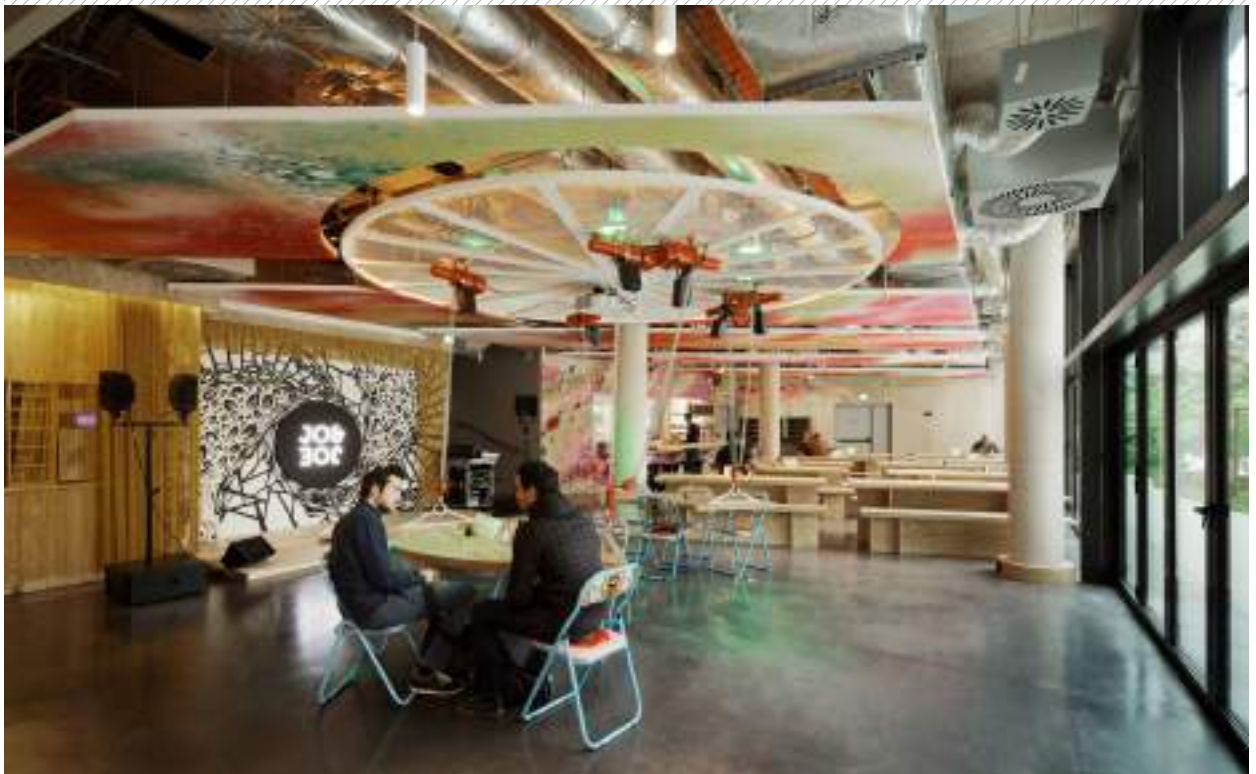
LE RESTAURANT ET LA SCÈNE DE SPECTACLE THE RESTAURANT AND THE STAGE