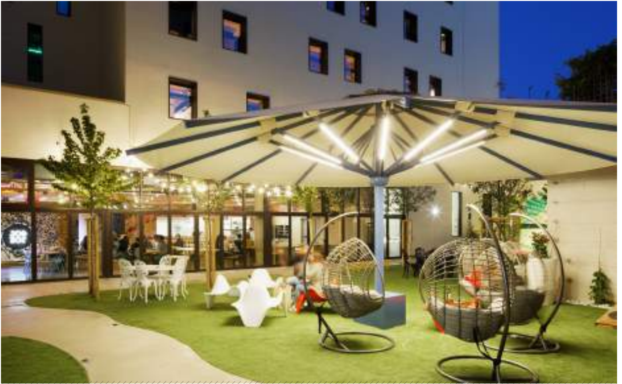
LE JARDIN THE GARDEN