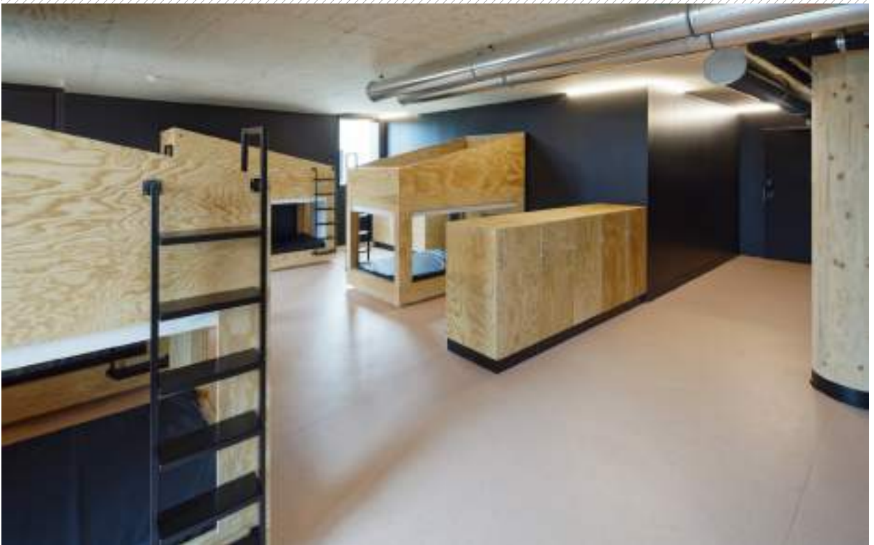
CHAMBRE COLLECTIVE SHARED ROOM