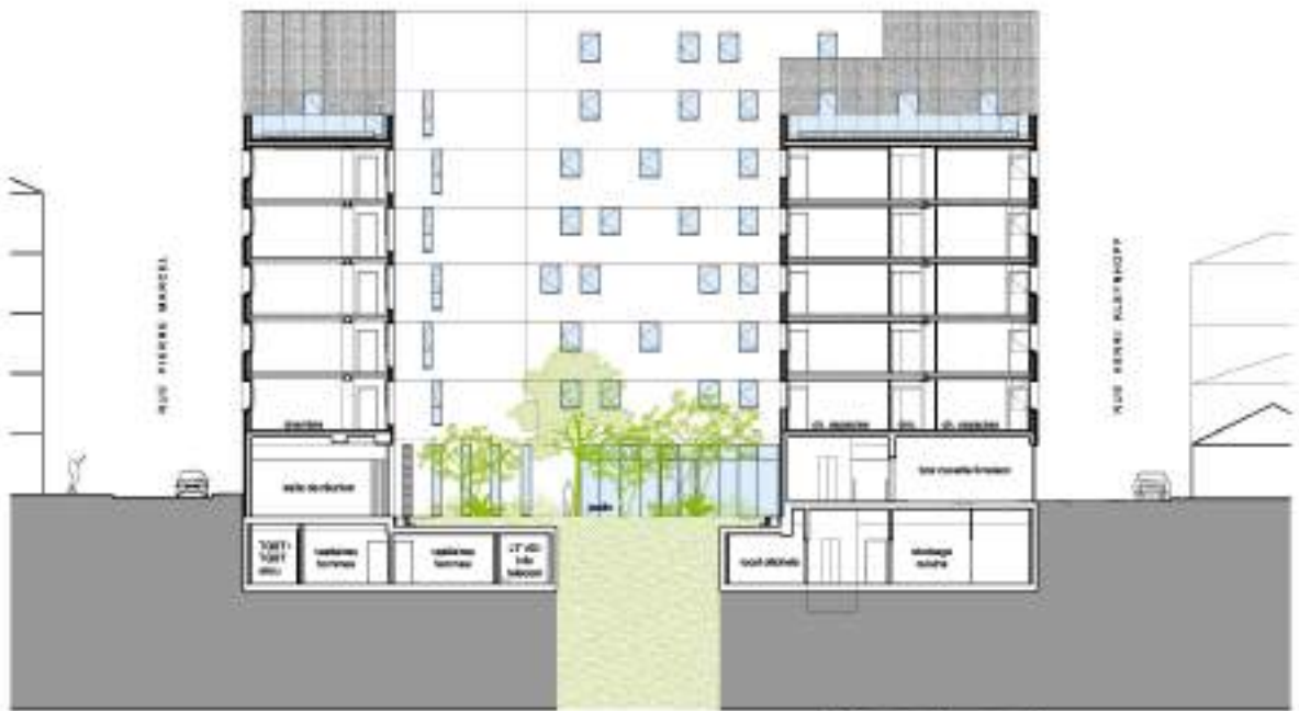
COUPE AA 1/200