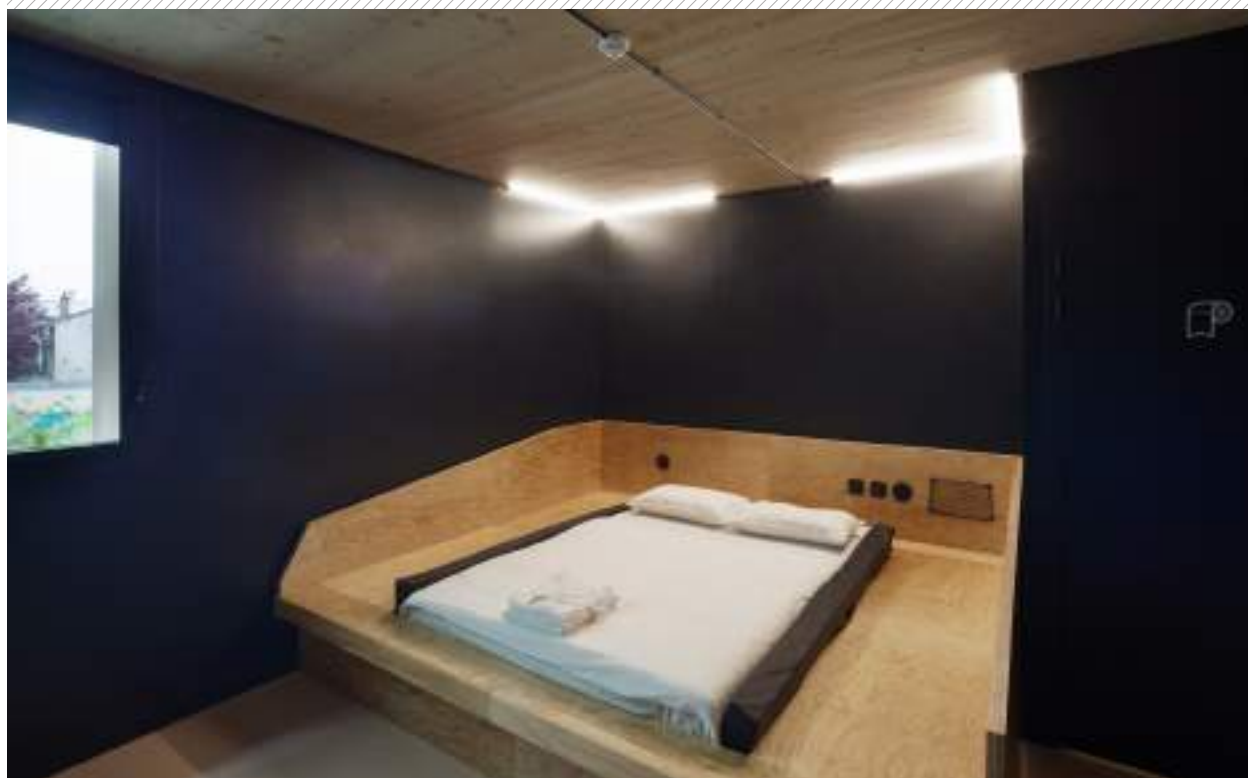
CHAMBRE PRIVATIVE PRIVATE ROOM