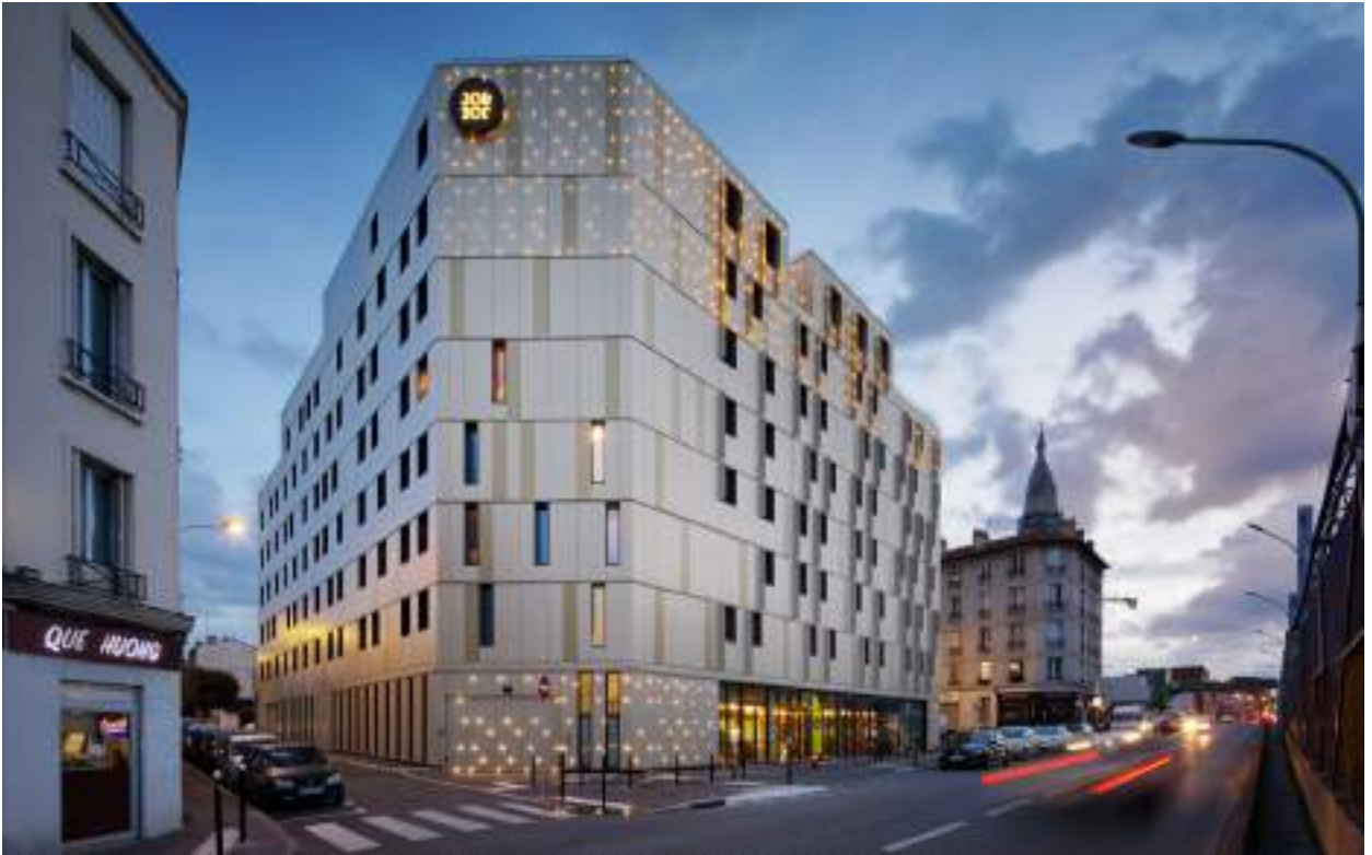
VUE DEPUIS L'AVENUE PAUL VAILLANT-COUTURIER VIEW FROM THE AVENUE PAUL VAILLANT-COUTURIER