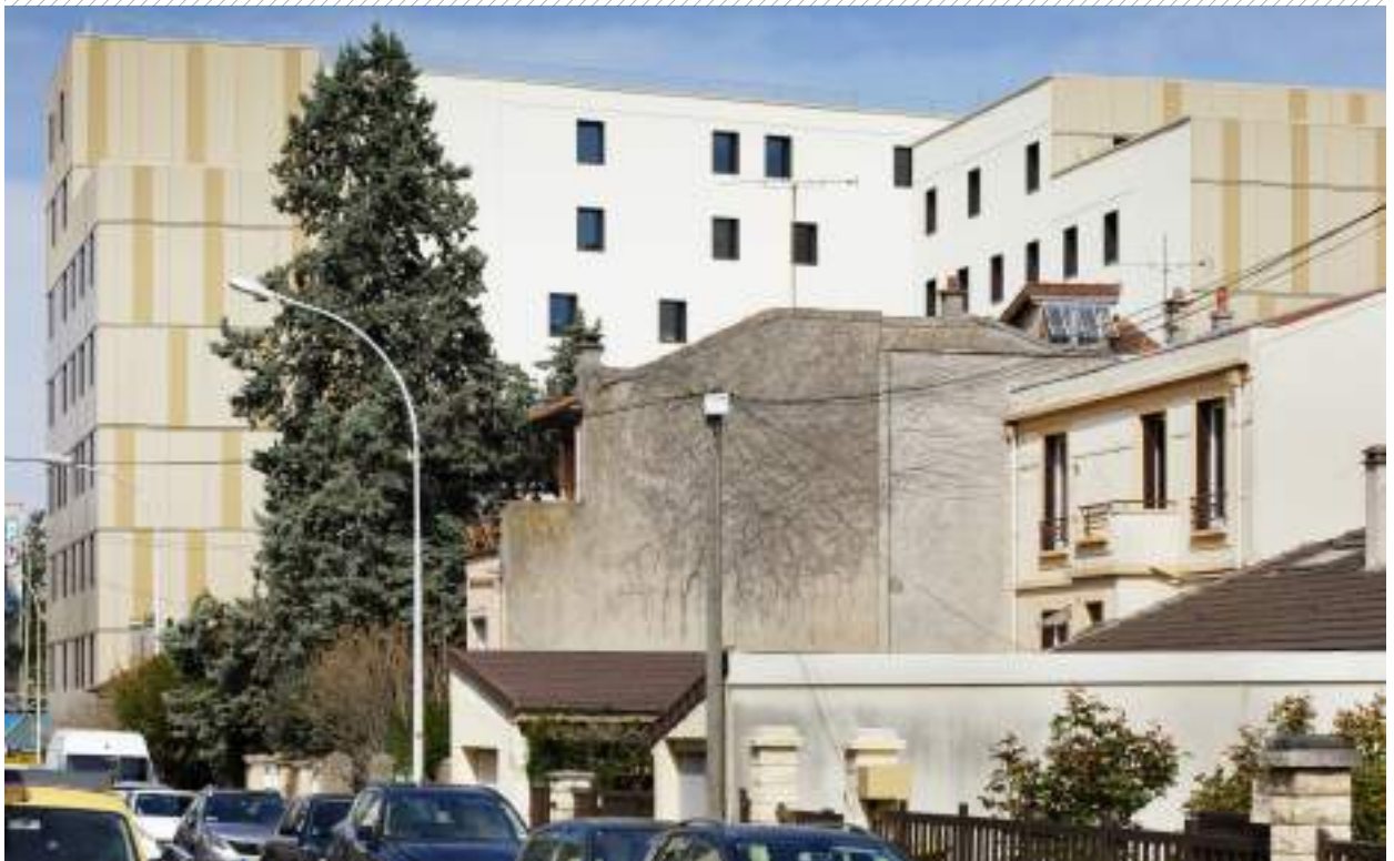
FAÇADE INTÉRIEURE SUR JARDIN DEPUIS LA RUE PIERRE MARCEL INTERIOR FACADE CIRCLING THE INTERIOR GARDEN VIEW FROM THE RUE PIERRE MARCEL