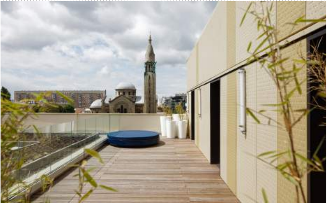
TERRASSE DU R+7 TERRACE OF THE 7 TH FLOOR