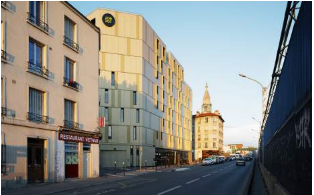
VUE DEPUIS L'AVENUE PAUL VAILLANT-COUTURIER VIEW FROM THE AVENUE PAUL VAILLANT-COUTURIER