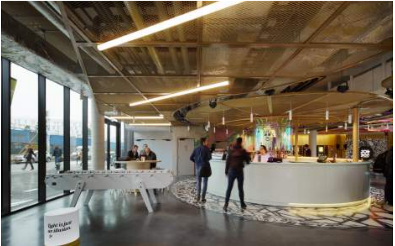
VUE SUR LE BAR DEPUIS L'ENTRÉE VIEW TOWARDS THE BAR FROM THE MAIN ENTRANCE