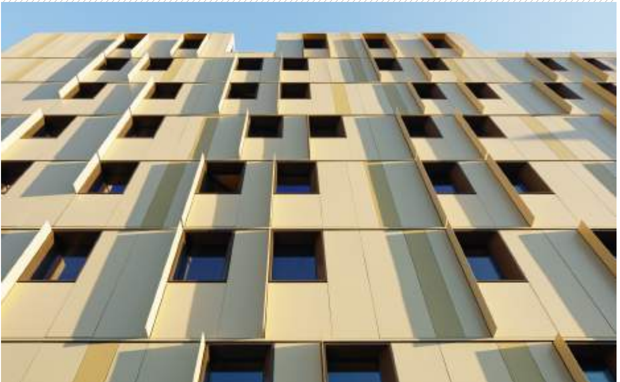
DÉTAIL REVÊTEMENT FAÇADE FAÇADE CLADDING DETAIL